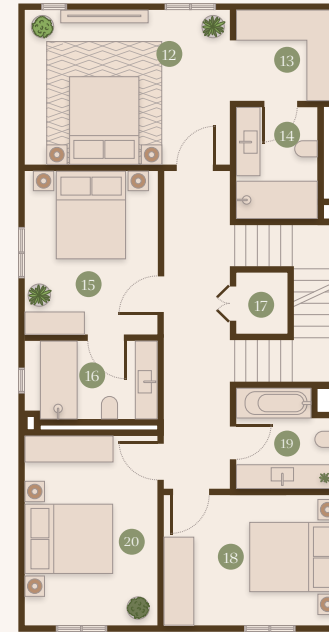
FIRST FLOOR الطابق الأول