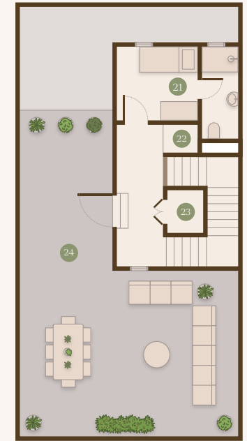
SECOND FLOOR الطابق الثاني