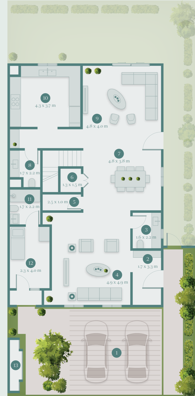
GROUND FLOOR الطابق الأرضي

Floorplan sizes and dimensions are indicative only and not to scale. Actual may vary. Rear and side landscaping not included.