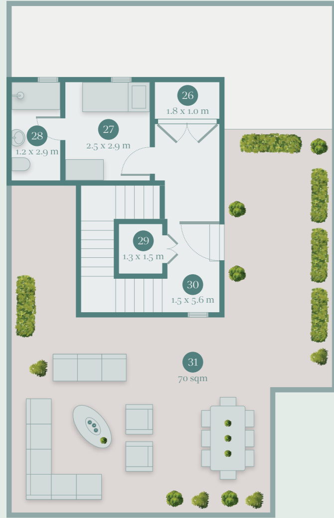
SECOND FLOOR الطابق الثاني