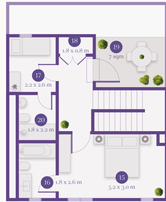
SECOND FLOOR الطابق الثاني