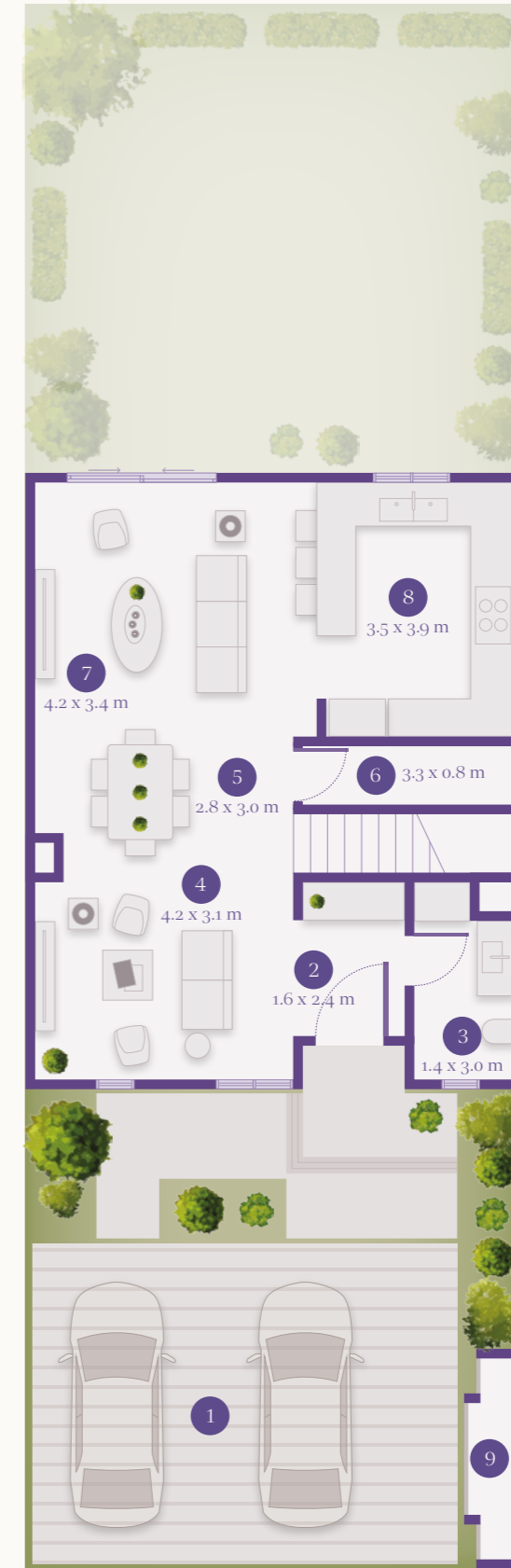
GROUND FLOOR الطابق الأرضي