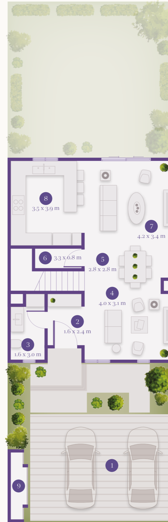
GROUND FLOOR الطابق الأرضي