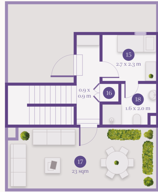
SECOND FLOOR الطابق الثاني